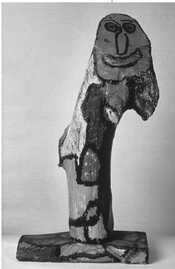
Gaston Chaissac Cím nélkül, 1960, olaj, farönk, 54×29×11,5 cm