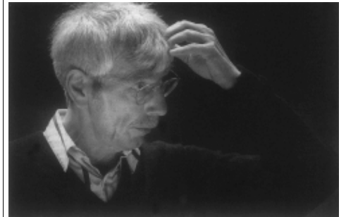
Reinbert de Leeuw