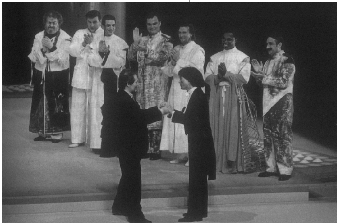
Eötvös Péter: Három nővér, Lyon, bemutató

A Három nővér Eötvös Péter operája – Lyonból indult. Az ősbemutató tényleg tökéletesnek volt mondható. Magam csak videofelvételen láthattam, de úgy is átütő hatása volt. A nagy ötlet, a női szerepek kontratenorokkal való megszólaltatása, a színház jelzéseinek a realitástól elszakadó szimbólumokká emelkedése, a japán No-színház elemeinek megvalósítása a szereplők mozdulataiban, a színpadképben mind-mind óriási súlyúvá növesztette a valóban