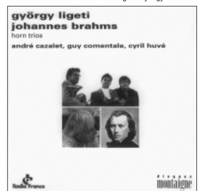
Ligeti György: Kürttrió